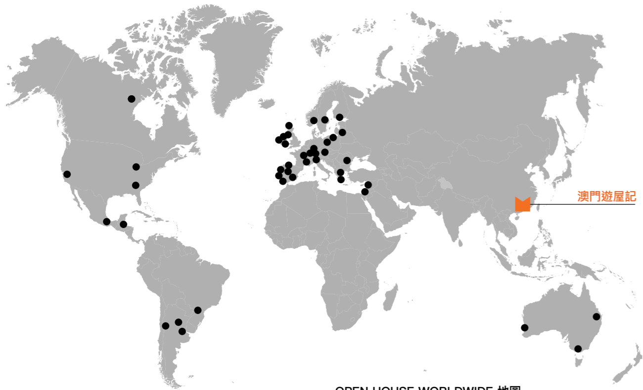
OPEN HOUSE WORLDWIDE 地圖 包括四大洲的40多個城市，並突出OHM在亞洲的先驅里程

Open House是全球最重要促進建築的機構之一。它傳達了一個簡單但強大的概念：邀請每個人完全免費探索和辯論精心設計的建築環境的價值。